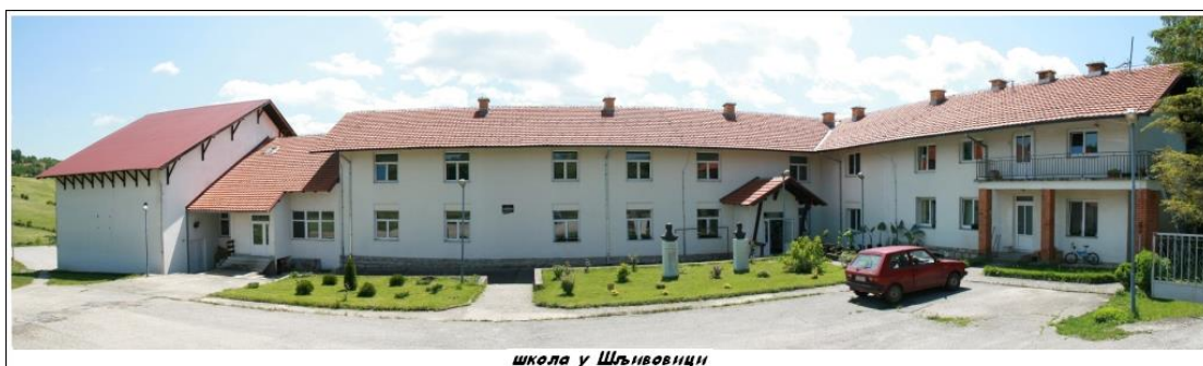
школа у Шљивовици

Министарство просвете и науке Републике Србије, школа је узимала учешће и у пројектима које финансирају министарства других земаља и Европска унија. Неки од тих пројеката су „Образовање за одрживи развој на Западном Балкану”, Пројекат прекограничне сарадње Србија – Босна и Херцеговина који финансира ИПТА и пројекат „Зелени талас” који је део ширег пројекта FIBONACCI. Школа је успешно реализовала и пројекте из области екологије За зелено сутра (међународни) и Свесно и савесно у сарадњи са Општином Чајетина. Од стране школе, био је подржан и пројекат Дан по дан-каледар сећања . Школа је са два координатора била укључена и у акцију Дарујмо реч , која је спроведена и у нашој школи која и даље траје. У сарадњи са организацијом ГИЗ БОС спроводимо пројекат Професионалне оријентације за ученике VII и VIII разреда. Од 2014. године наша школа укључена је и у међународни програм „Еко школе”, а добијање зелене заставе и стицање статуса еко школе , школа очекује до краја 2015. године.