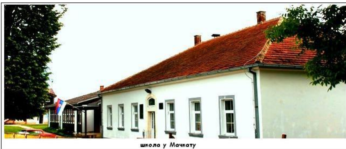
школа у Мачкату

Ова школа једна је од најстаријих у златиборском округу, постоји од 1859. године. Данас у оквиру матичне школе раде још четири издвојена одељења и то осморазредно одељење у Шљивовици и четвороразредна одељења у Кривој Реци и на Горњој Шљивовици. Школу укупно похађа 220 ученика. У школи је запослено 31 радник у настави и 15 радника ненаставног особља. Састав наставног колектива обезбеђује стручно извођење наставе.